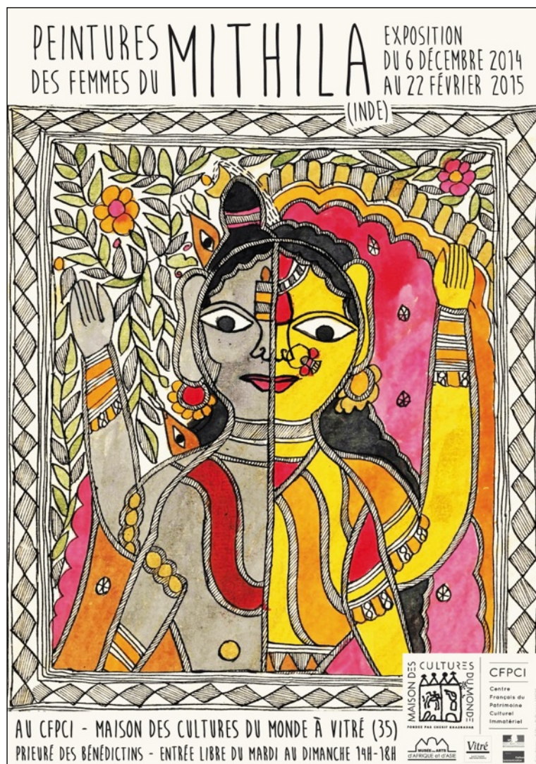
Affiche de l'exposition