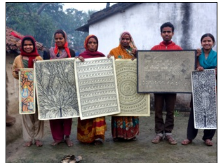
Peintures du Mithila © Deidi von Schawen