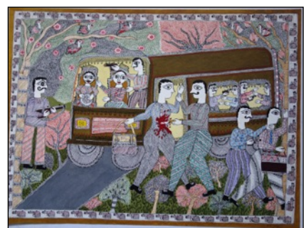
« L'enlèvement de Sita par le Roi-démon Râvana », Kohabar (représentation tantrique), et "L'attaque du train" (oeuvre contemporaine) toutes trois présentées dans l'exposition.