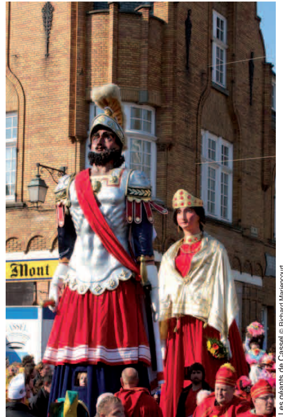
Les géants de Cassel

A l'occasion des 10 ans de la Convention pour la sauvegarde du patrimoine culturel immatériel, le CFPCI met à l'honneur le premier élément français inscrit sur les listes de l'UNESCO à travers une exposition multimédia réunissant vidéos, photos, éléments de structures gigantesques... et quelques invités surprises !