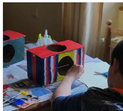
Ateliers création à la Maison des Cultures du Monde

02 99 75 82 90 | sc.mediation@maisondesculturesdumonde.org