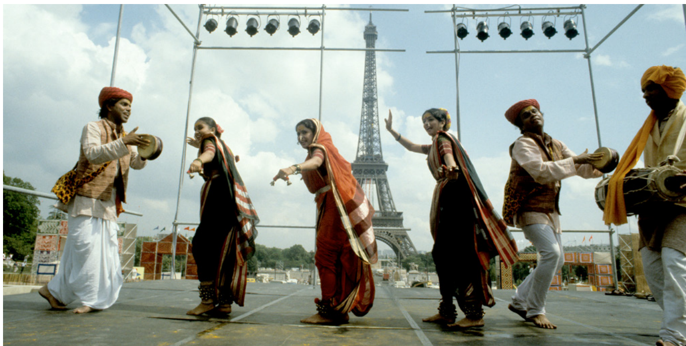
Danse de femmes de l'Inde du sud accompagnée au tambour kanjira et mridangam, Grand Mela d'ouverture de l'année de l'Inde en France organisée à Paris en 1985