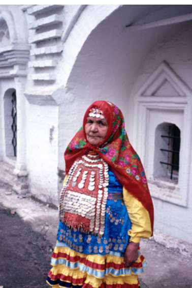
Chanteuse bachkire (Russie) 1989

Dans les années 1990, la Maison des Cultures du Monde a également contribué à fonder une discipline universitaire appelée « ethnoscénologie ». Celle-ci étudie les différentes formes de spectacles vivants dans leur globalité et leurs interactions avec les sociétés qui les produisent. Elle tente de se détacher de l'ethnocentrisme et des classifications occidentales qui ont tendance à séparer les différentes pratiques, alors que le spectacle vivant mêle souvent de nombreuses disciplines artistiques.