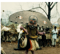
Makishi, danses masquées des peuples du Zambèze, 1999