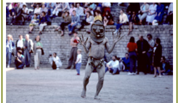
Les Papous à Paris, musique et danse des Mudmen, 1990