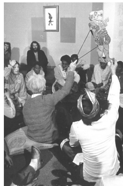
Animation « Théâtre d'ombres » de Grèce pour le 6e Festival des Arts Traditionnels, 1979