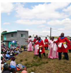
Le Hira Gasy, opéra des champs, 2018