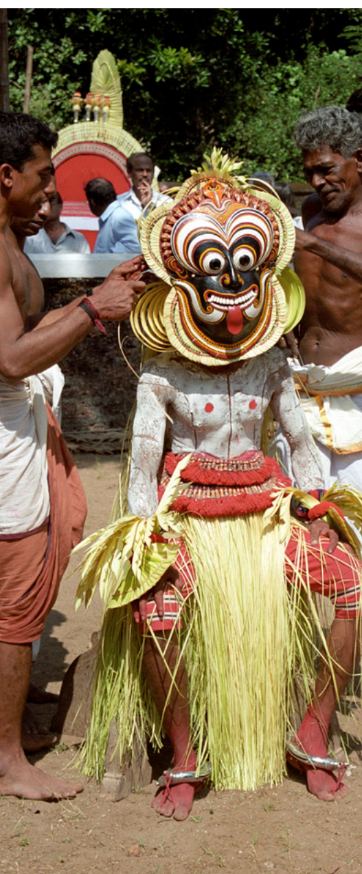
Rituel du Teyyam, région du Kerala (Inde) Préparation du personnage de Gulikan, dieu de la mort, 2003

Au début du processus de programmation des spectacles intervient la phase de rencontre avec les artistes. La collaboration avec des chercheurs, anthropologues ou ethnomusicologues par exemple, facilite leur identification. L'intérêt de cette collaboration est double : ces interlocuteurs connaissent parfaitement leur terrain (le lieu de leur recherche), la forme spectaculaire en question et le contexte dans lequel elle est présentée. Ils servent aussi d'intermédiaires avec les artistes qu'ils connaissent et avec qui ils nouent souvent des liens personnels. En contribuant à faire venir les artistes étrangers sur une scène française, ils donnent de la visibilité à leurs travaux de recherche. La spécificité de la Maison des Cultures du Monde ne repose pas seulement sur la production-diffusion de spectacles de « musiques du monde », mais elle offre aussi un espace ouvert aux milieux universitaires, encourageant les travaux des jeunes chercheurs et la production de nouveaux contenus.