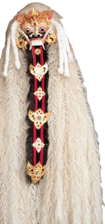
Masque de Rangda du Calonarang de Bali (Indonésie)

Il s'agit de montrer dans cette exposition le passage du terrain à la scène - de la recherche au spectacle - à travers des photographies, des enregistrements, des objets et les témoignages des passeurs ayant accompagné ce cheminement.