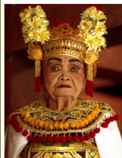
Le Calanarong, théâtre d'exorcisme, 1987, 2005