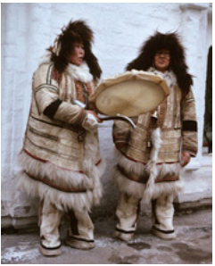
Chant des chamanes nganassan du Taïmi 1989