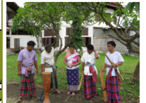
Molams et mokhènes, chants et orgue à bouche, 2009