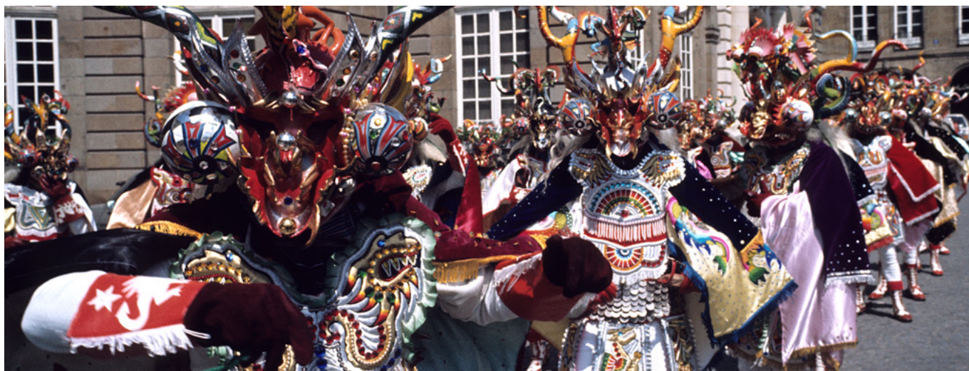
Défilé de la Diablada d'Oruro de Bolivie sur la place de la Mairie à Rennes durant le 7e Festival des Arts Traditionnels, 1980