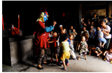
Nuo de Nanfeng de la province du Jiangxi, 2008