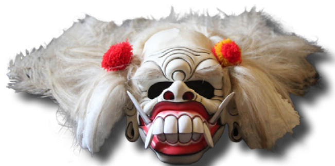
Masque de Celuluk du Calonarong de Bali (Indonésie)