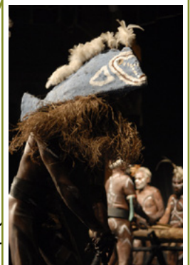
Danses et tracés sur sable de l'île de Malakula, 2006