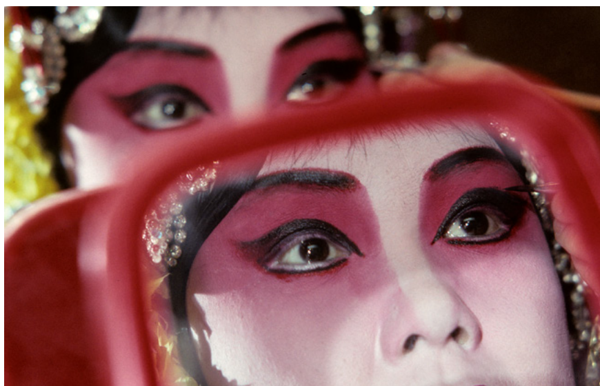
Médée, d'après l'oeuvre d'Euripide, opéra chinois du Hebei Bangzi, 1993

En train 1h30 de Paris en TGV / 30 min. de Rennes En voiture 30 min. de Rennes / parkings gratuits et payants en centre-ville