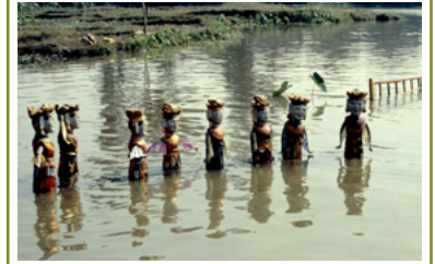
Marionnettes sur eau, 1984, 2017 © Bruno Français