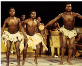
Pygmées Bedzan Polyphonies vocales, danses et masques, 2000