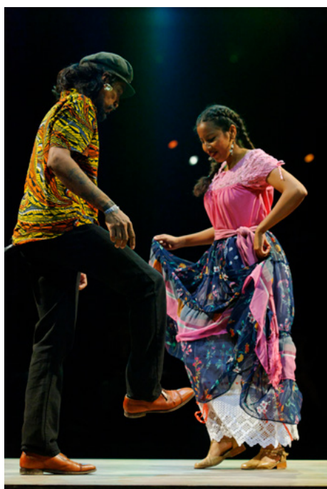
Fandango (Mexique), 2019