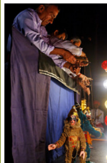
Marionnettes du Yakshagana, 1983, 2012