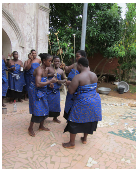
Ajogan, ballet rituel du royaume de Porto-Novo (Bénin), 2021