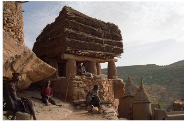
Dans le village dogon de Bandiagara (Mali), 1998

L'ethnologie est une discipline des sciences humaines et sociales qui étudie l'homme en société , les rapports sociaux propres à chaque groupe humain ou à chaque situation, s'intéressant à la grande variabilité des formes de vie sociale.