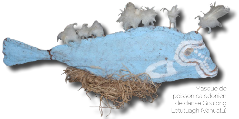
Masque de poisson calédonien de danse Goulong Letutuagh (Vanuatu)