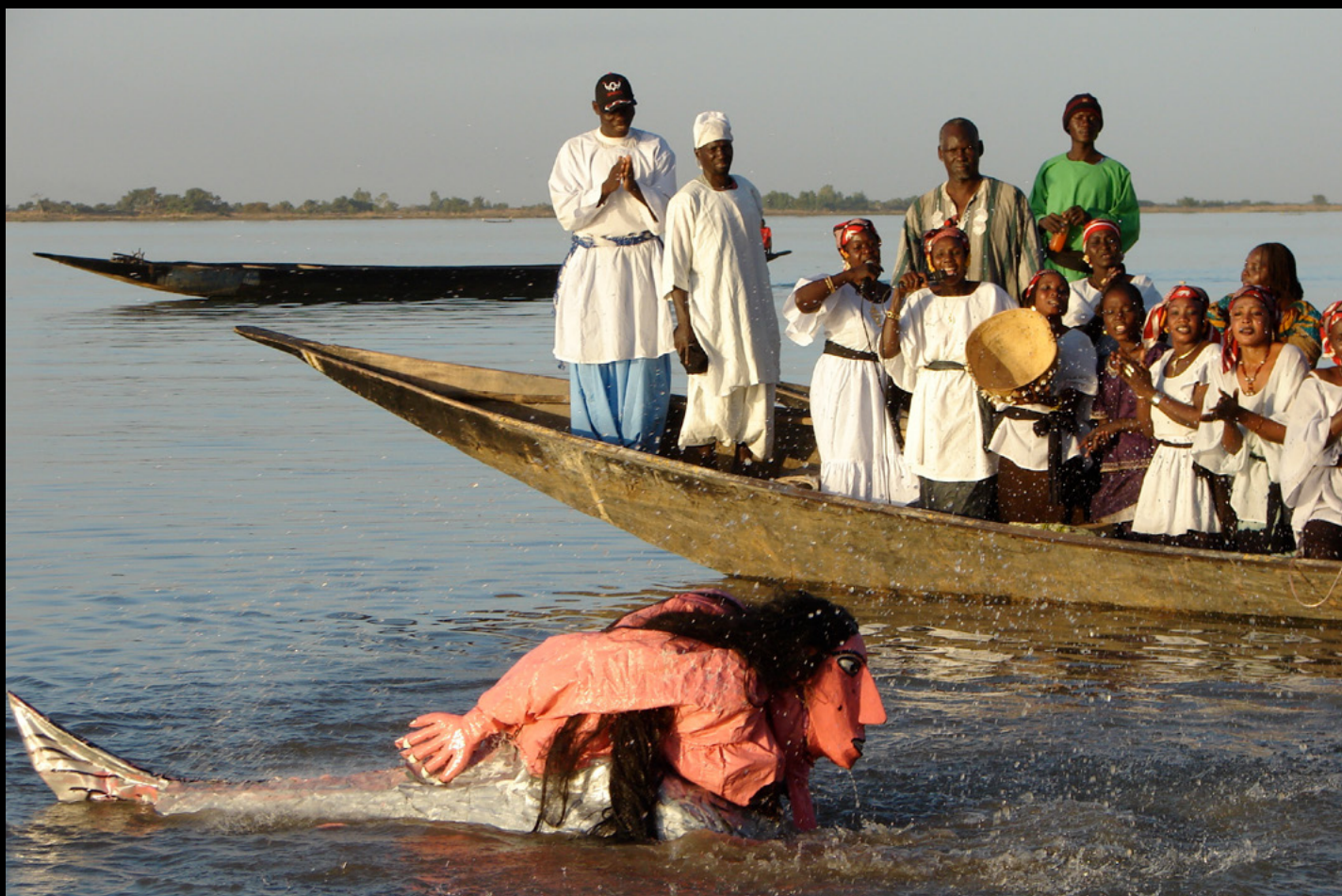
Festival sur le Niger, Ségou