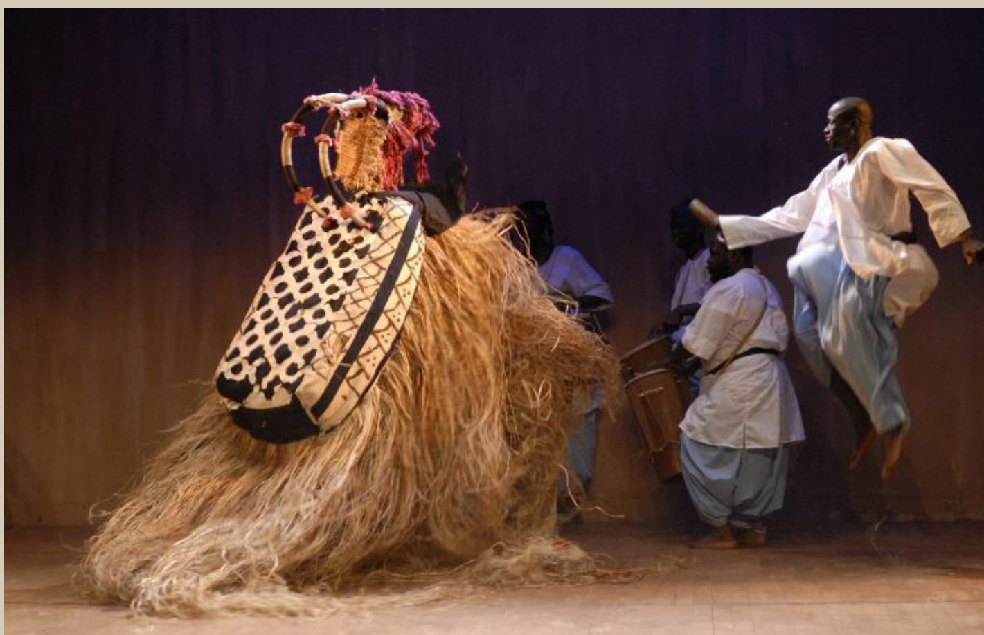
Festival de l'Imaginaire, 2008

Des films de terrain réalisés par l'anthropologue Elisabeth Den Otter permettent d'illustrer le contexte lié à la tradition des marionnettes bamanan et bozo. Une sélection d'archives audiovisuelles issues des fonds de la Maison des Cultures du Monde enrichissent également l'exposition.