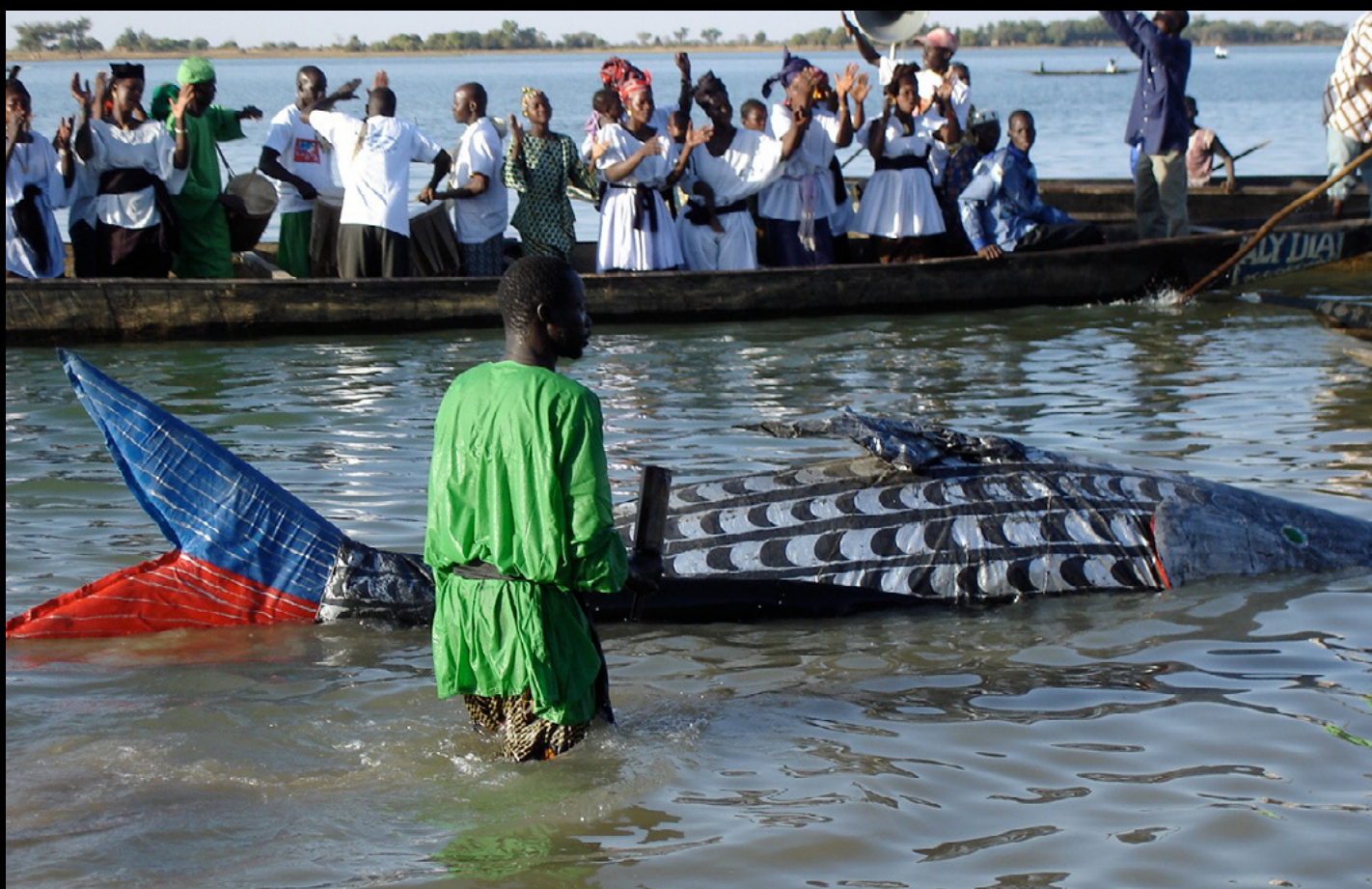
Festival sur le Niger, Ségou

Cet ensemble est accompagné de percussions et de chants menés par deux chanteurs principaux accompagnés d'un chœur de femmes. Les chansons se réfèrent à la personnalité du personnage, aux légendes, ou servent de métaphores à de nombreux comportements humains. La musique, les chants et la danse jouent un rôle important durant la mascarade ; la participation des spectateurs permet de qualifier ces fêtes de véritable « théâtre total ».